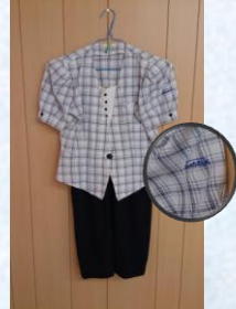
船鉄のバスガイド制服A (上11号、下9号) スタート価格 4,000円～