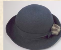
船鉄のバスガイド帽子 スタート価格 各 2,000円～