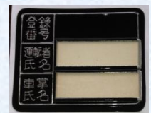
船鉄の車内乗務札(アルミ) スタート価格 1,000円～