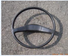
いすゞバスのハンドル スタート価格 5,000円～