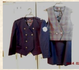
サンデンのバスガイド制服E(11号) スタート価格 3,000円～