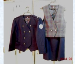
サンデンのバスガイド制服D(9号) スタート価格 3,000円～