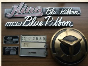
防長バスのヘッドマーク・エンブレム他セット スタート価格 5,000円～