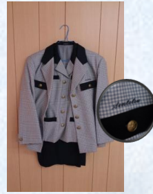
船鉄のバスガイド制服B (上下11号) スタート価格 4,000円～