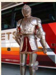
せんてつレストランドアポイ (等身大西洋甲冑) スタート価格 100,000円～