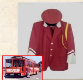
岩国市営バス「いちすけ」の制服 スタート価格 2,000円～