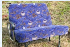
サンデンの路線バス2人掛けシート スタート価格 2,000円～