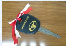
DAEWOO BUS 日本初導入記念キー スタート価格 3,000円～