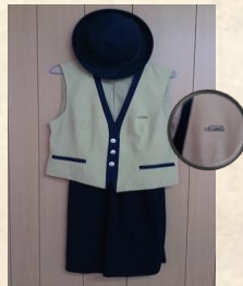
船鉄のバスガイド制服C (帽子付、上13号、下11号) スタート価格 3,500円～