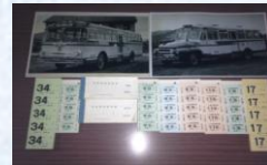
昔懐かしい「せんてつバス」乗車券セット スタート価格 1,000円～