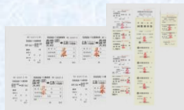
防長バスの回数乗車券・往復乗車券・ 片道乗車券の見本(セット) スタート価格 2,000円～