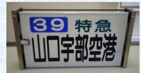
宇部市営バスの方向幕No3(側面1基) スタート価格 3,000円～