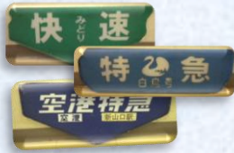
宇部市営バスの行先板 (ヘッドマーク3枚セット) スタート価格 6,000円～