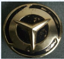
防長バスヘッドマーク(貸切・高速バス用) スタート価格 3,000円～