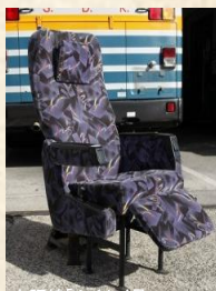
サンデンの夜行高速バス座席シート スタート価格 5,000円～